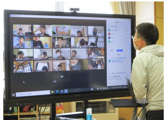
画面を通して真剣に学ぼうとする子ども達

今後ますますICT機器を活用した学習が進んでいくこととなります。堺町小学校では、改善すべき点は改善しながら、児童の学力向上に努めて参ります。保護者の皆様には今後ともご理解とご協力をお願い申し上げます。